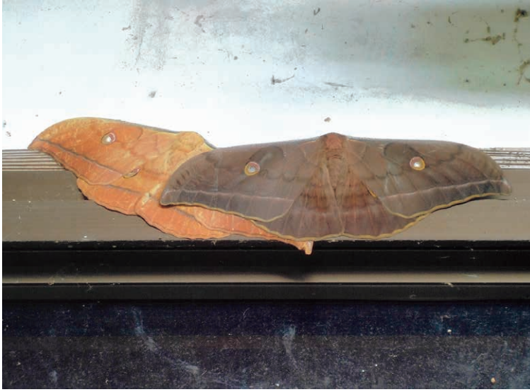
「クスサン」の雌雄。黒っぽい雄が赤褐色の雌を抱く

ヤガの類と思われる蛾にも興味を持ち、保有社の『原色日本蛾類図鑑』を調べてはみたが期待はできなかったとおり、図鑑のサンプルは全てがそうであるように展翹板に張り付けた図なので、羽を閉じて背の上でのテント状の形は説明されてはいないので、種の同定には至らず、「ヤガ」の類いであることで終わらざるを得なかったのが