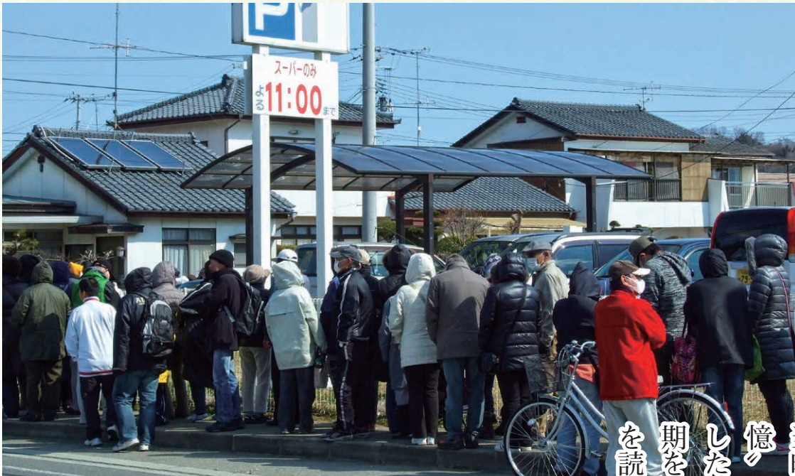
市内のスーパーなどには水、食糧を求め、多くの市民が朝早くから列をつくり、開店を待った

東日本大震災が発生した平成二十三年三月十一日から十一年が経過。復旧復興が進む中、 当時を思い出すことも少なくなった。震災の記憶を 忘れないためにも、「記録」を掘り起こした「震災から一週間」の 激動と混乱。この時期を市のドキュメントに類した、公式発表資料 を読み返し、振り返った。