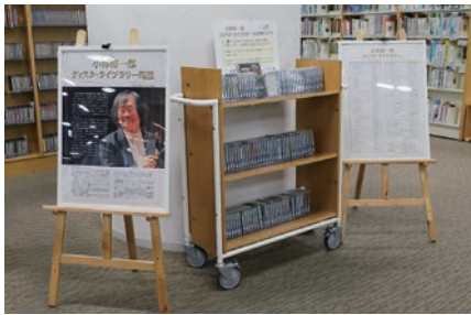
市内出身の指揮者「小林研一郎」特設CDコーナーも開設