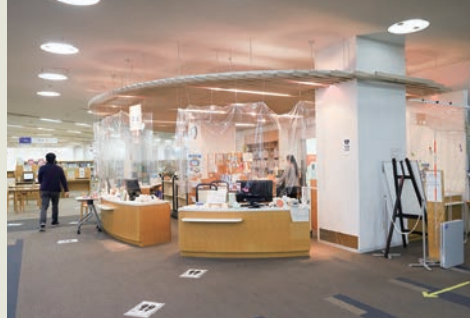
土日祝日も開館し、多くの市民が利用する窓口