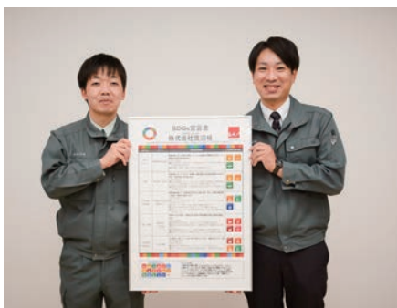
同社が策定した「SDGs宣言書」

内容は、製品サービス、環境、人権、労働などの五分野で構成。それぞれ環境への配慮や脱炭素