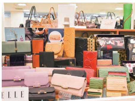
縁起が良い「春財布」

ら、新春に買い替えると運氣が良いとされている。お勧めは、使うほど味が出るDakota（ダコタ）、ポップでカラフルなFRAME WORK（フレームワーク）やELLE（エル）などの二つ折り、長財布（二万〜二万円）。最近では、ポシェットの愛用者が多いためか、小さめで収納たっぷりの財布（同）も人気。ミセスには、大人かわいい「Think Bee!」のバッグ、財布（一万〜三万円）も取りそろえている。