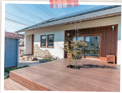
家族が集える広いウッドデッキ