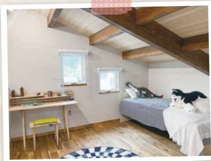
柔軟な使い方ができる子供部屋