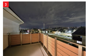
③プライバシーを確保した屋上バルコニー。近隣建物より高い場所で景色を楽しめる