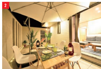
②屋外での食事やパーティーが楽しめる「アウトドアリビング」。気持ちの良い季節には、素敵な時間が過ごせる