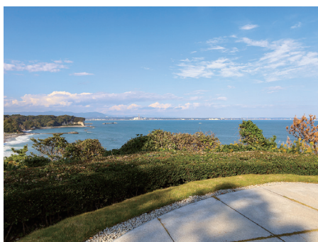
←館外には展望台があり、いわき南部が見渡せる