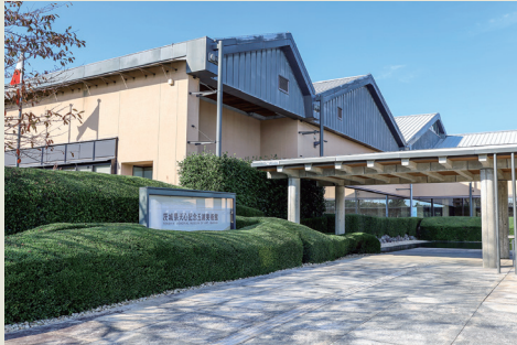
緑あふれる広い敷地内は、まるで公園のよう