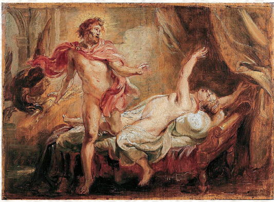
●ピーテル・パウル・ルーベンス「セメレーの死」 1640年頃=ベルギー王立美術館蔵